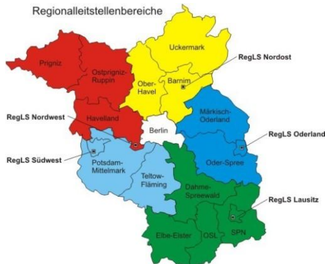
Abbildung 2: Regionalleitstellenbereiche im Land Brandenburg

Die Funktion der Leitstelle (§ 9 BgRettG) wird aufgrund einer öffentlich-rechtlichen Vereinbarung durch die Regionalleitstelle Brandenburg an der Havel wahrgenommen.